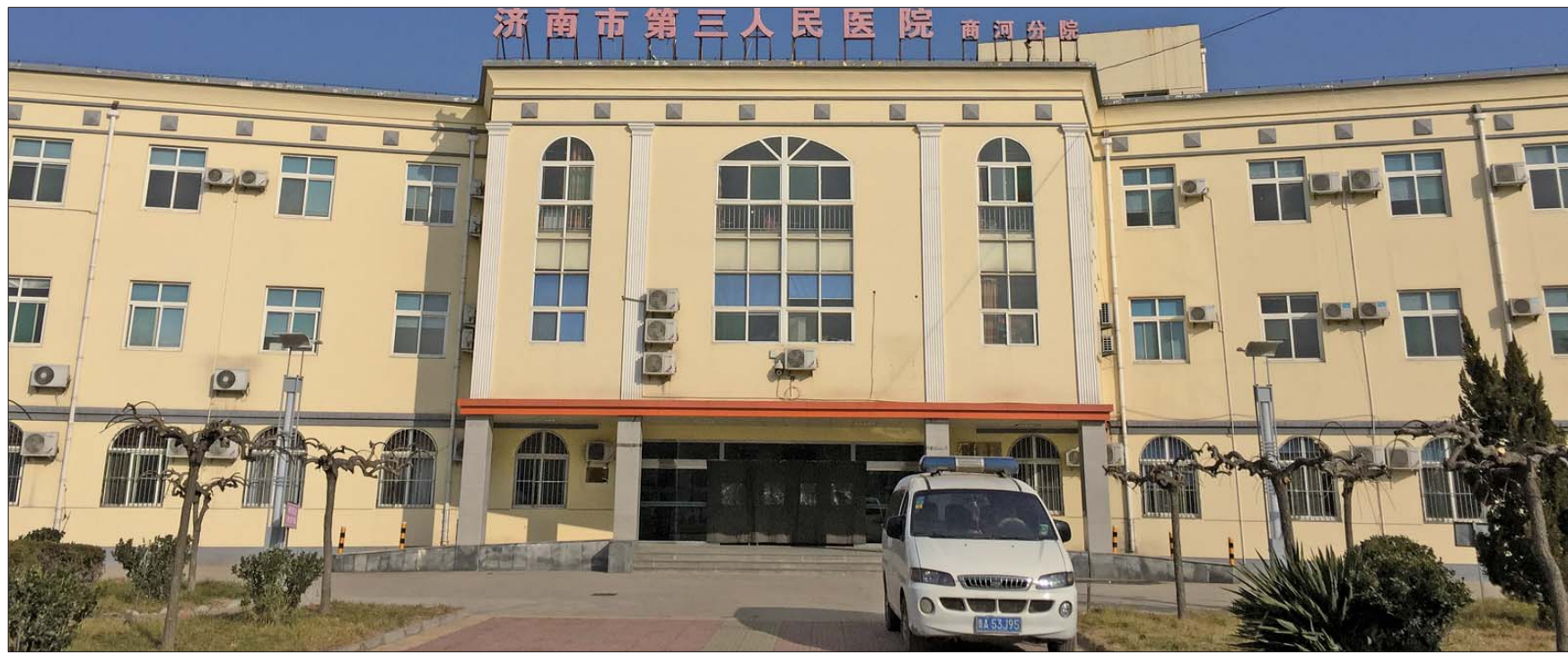
龙桑寺镇卫生院综合楼外观。

近年来,济南市卫生局经过深入调查研究,大胆创新在济南市商河县试点推行“市级医院承办乡镇卫生院”这一卫生支农新模式。济南市第三人民医院受济南市卫生局委托,承办了商河县龙桑寺镇卫生院,经过这几年的发展,龙桑寺镇卫生院取得的成绩让所有人惊喜,其中,卫生院的金牌科室外科以及妇产科更是受群众称赞。