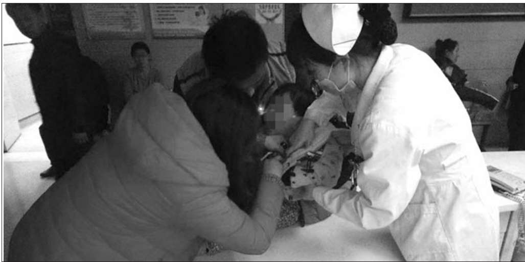
交警开道将患儿顺利送到医院救治。