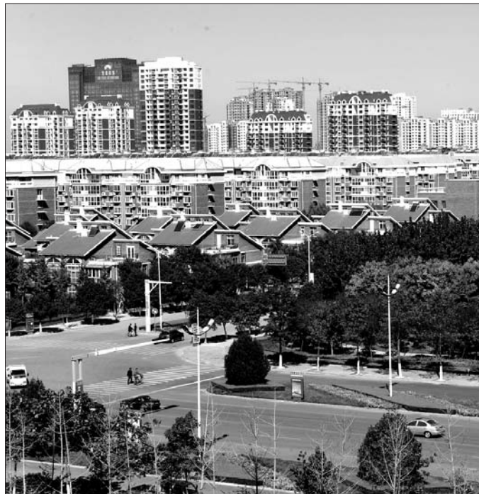
新机场将落户美丽的兖州区。

抢抓新机场、鲁南高铁站等重大基础设施布局机遇,今年兖州区将依靠新机场超前规划空港产业园,并高标准规划建设鲁南高铁兖州站区,尽快显现“高铁效应”。在兖州区2017年的《政府工作报告》中,能明显感受到兖州区已抓住了发展的新机遇。