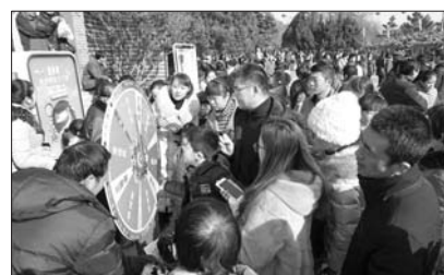
30余家旅游企业在景区开展营销会。

蓬莱阁相关负责人表示,蓬莱阁作为全市旅游龙头企业,就是要充分发挥行业引领作用,积极搭建展示交流的平台,利用深厚的文化优势,推进全域旅游