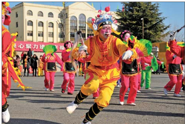
▲乳山大秧歌之乐大夫表演。

去年下半年,经中国民间文艺家协会组织专家实地考察,乳山市顺利通过评审,被命名为“中国秧歌之乡”,成为本年度唯一获此命名的城市。以获得“中国秧歌之乡”称号为契机,下一步,乳山将继续把大秧歌作为弘扬优秀传统文化、促进文化事业繁荣发展的重要载体,加大引导扶持力度,建立完整的传承保护体系,不断提升大秧歌艺术水平,推动大秧歌尽快融入市场,为发展文化产业创造条件。