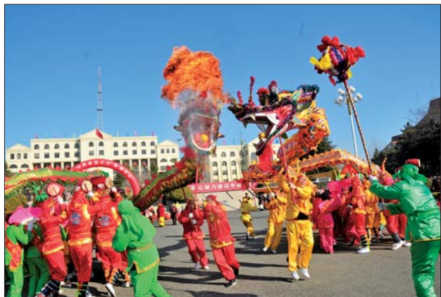
▲乳山大秧歌最大特色——耍火龙表演。王嘉 摄