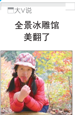
大V说 全景冰雕馆美翻了

VR全景设备还有一个相当大优势,就是可以增加观看者的参与感与互动性,观看者会置身其中的感觉,这是很多户外运动爱好者,以及喜欢拍摄和记录的用户都想要的,并且还有很高的趣味性和可玩性。