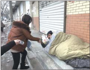
睡在大街上的流浪人员拒绝去救助站,救助员为其发食物。

济南救助站办公室主任张华伟表示,很多流浪人员对救助站有误解,认为会被强制送回家,但实际上我们遵从个人意愿。据了解,送回家或接到救助站再跑出去的流浪人员占八成。每年寒冬,济南市救助站都会加强主动救助密度。面对这种“送上门”的救助服务,大多数流浪乞讨人员并不待见,往往只领取救助物资。针对不愿进站流浪人员,济南市救助站2013年于救助站南楼一楼设立冬季临时救助点,敞开式管理——简单登记便可入住,想来就来,想走就走,但流浪人员很少“光顾”。