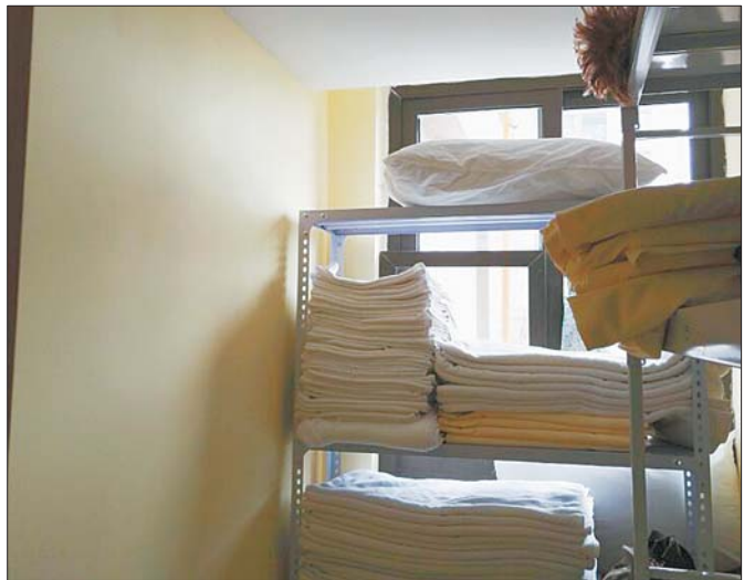
绿地中央广场一处燃气管道从外面看穿入三楼该房间,到房内已找不到管道。

大中电器 DAZHONG ELECTRONICS 客服热线: 4006586058