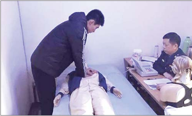
学员在进行应用能力实际操作考试。

联众舜通驾校负责人介绍,从2014年底他们就推出了学员自主预约教练,目前学员通过微信就可以自主选择教练、自主选择练车时间等。