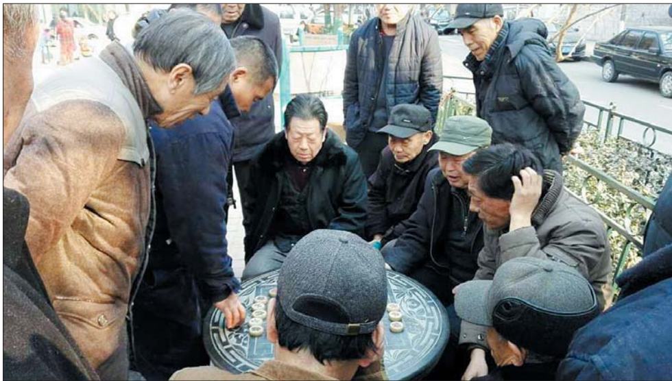
2月15日上午,甸柳二居在小广场开展“以‘棋’会友·喜相逢”活动,吸引了社区内象棋高手,云集在一起交流棋艺。通过活动,让社区的居民一方面促进了交流;一方面凝聚民心;另一方面促进了社区的和谐。(本报记者 林媛媛)

辖区沿街两侧违章建筑、违章广告及临时建筑展开排查整治,对辖区出入口、主次干道两侧、重要场所周边违章搭建的各类建(构)筑物进行拉网式排查和清理,全面提升整体环境水平。另一方面,加强日常管理,每日上午、下午各增加两次巡查,对新的乱搭乱建实行“零容忍”,一经发现,立即拆除;对历史遗留的乱搭乱建,分别记录在案,按照今年全市拆违拆临行动要求,及时完成拆除任务。