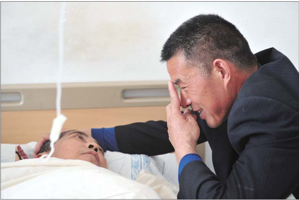
为减轻亲家的痛苦,有空就陪亲家拉家常,讨论给未来的小孙子起名字。