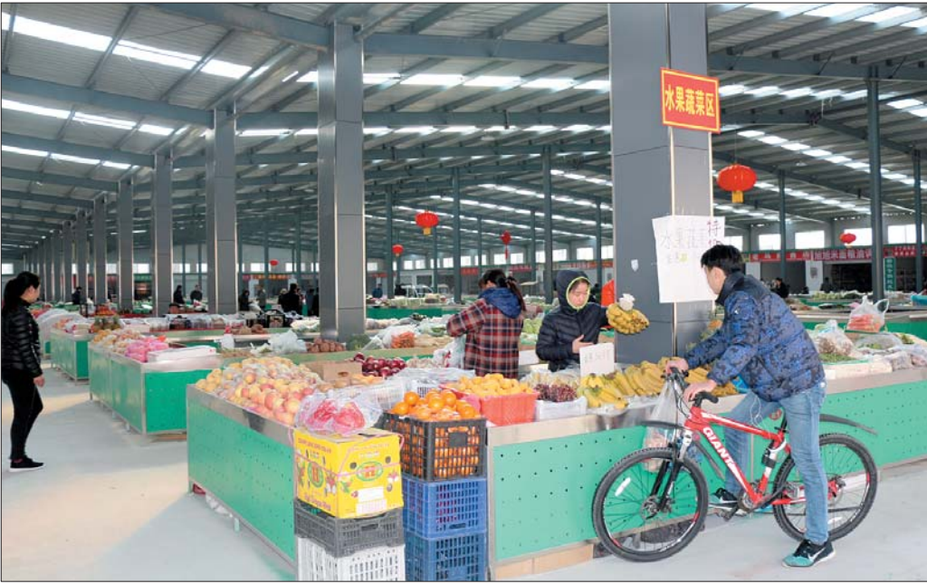
市民在新建成的便民市场里买菜。

据了解,长江路东段、武汉路、巢湖路等占路经营由来已久,不少浮游商贩在周边自发形成了一个“小市场”。无秩序