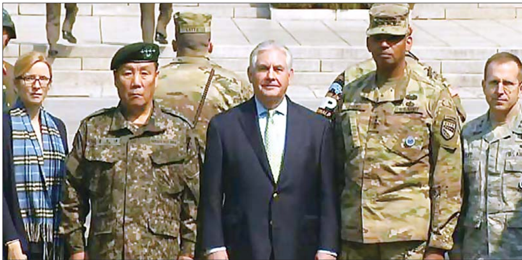
美国国务卿蒂勒森(中)到访板门店。

日本方面,尽管此次蒂勒森成功笼络住了日本,但美日同盟仍存在不确定性。美国总统特朗普一直批评包括日本在内的贸易伙伴在对美贸易中占了便宜,在贸易谈判中主张进行双边谈判而不是多边谈判,以更好地发挥美国的优势。为换取美国对日本一贯的安全承诺,安倍今年2月访美时送上了经济大礼包,其中就包括同意