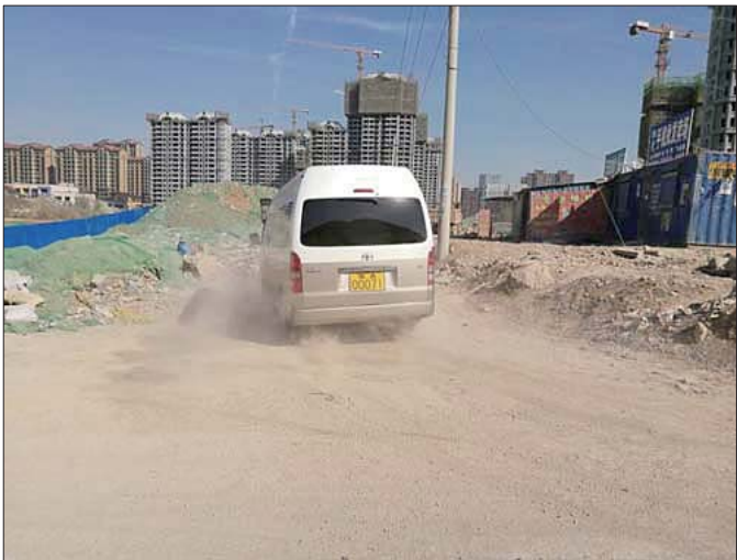
车辆经过之处,“惊起”一片扬尘。(资料片)