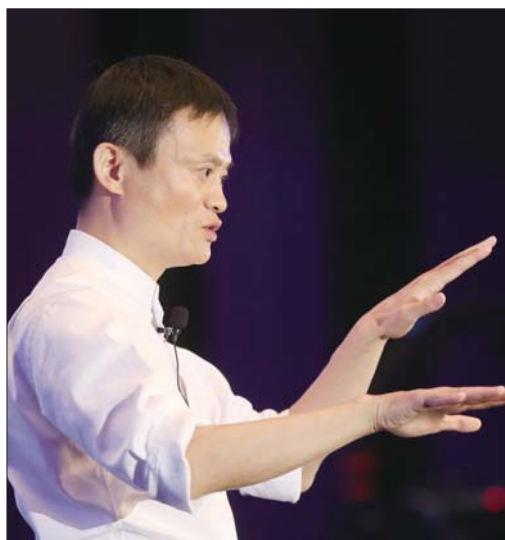
近来,关于电商究竟属不属于实体经济形成了“宗马之争”。

3月19日出版的《人民日报》,在题为《浙江 实体经济正质变》的头版头条报道中点赞阿里巴巴,认为以阿里巴巴为代表的新实体经济正在迅速崛起。这是官方媒体首次以“新实体经济”为阿里巴巴定性。在中央多次提出要振兴实体经济,防止“脱实向虚”的背景下,这一举动无疑给很多像阿里巴巴这样的互联网企业吃了一颗定心丸。而关于实体经济的“新”“旧”故事,这其中可大有学问。