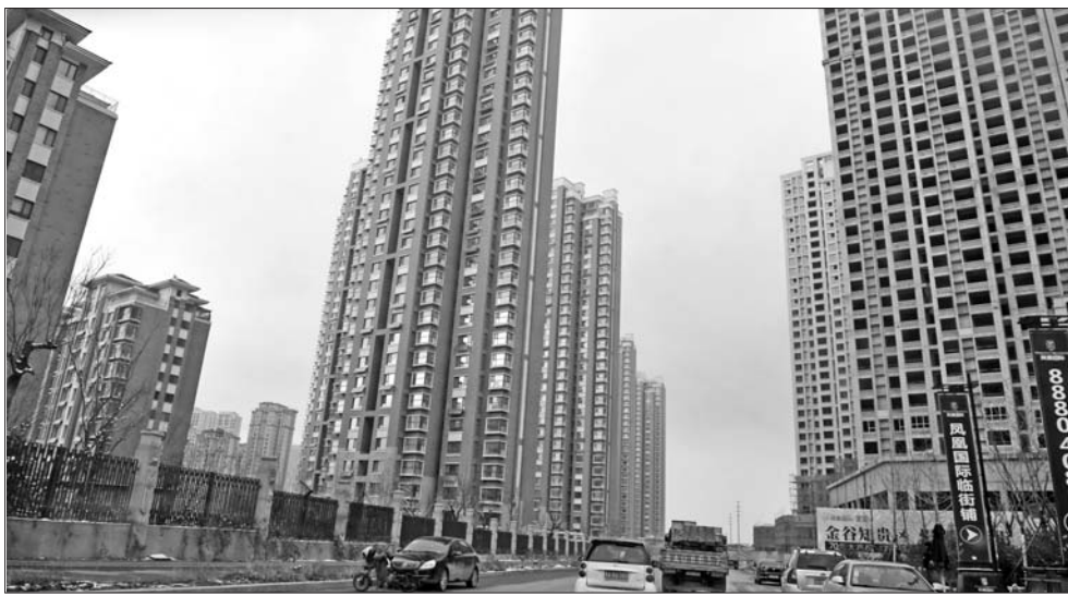
济南相关部门证实,济南当前并未讨论具体限购政策。(资料片)