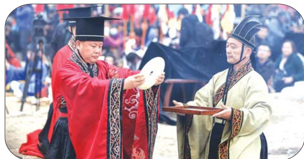
祭祀中的奠币仪式。