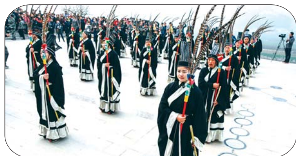
祭祀现场跳起八佾舞。

族世代传承,是维系中华民族文化得以传承的重要精神支柱,是整个民族公认的标记和符号。“仁人贤达共谒伏羲女娲,能让华夏儿女更好地记住历史、振兴中华,进而增强民族凝聚力与向心力。”