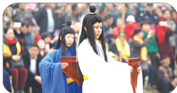
郭里中学的学生们表演“六小舞”。