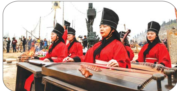
文明社会时期的祭祀仪式。