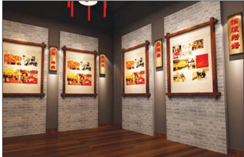
聊城婚俗博物馆布展效果图。