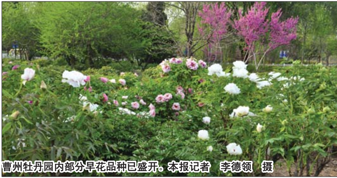
曹州牡丹园内部分早花品种已盛开。

在曹州牡丹园东大门，园内工作人员正在布置花柱、花球，以增强观赏效果，增加节日气氛。“我们已对园内引导标识牌、景点介绍牌、大田牡丹品种介绍牌、导游分布图和全景图，以及木制游客休息座椅等进行