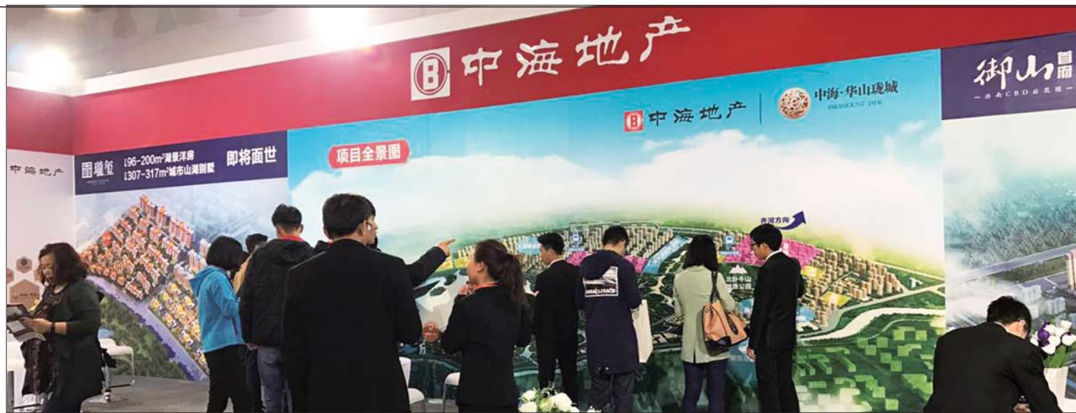
中海展位吸引了众多购房者光顾