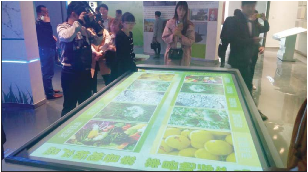
莘县会展中心已经布展完毕,以迎接第六届中国(莘县)瓜菜节暨中原现代农业嘉年华启幕。

展会期间,在会展广场分类设置酒水副食、日用小商品区,美食小吃区,小型汽车、农用车、电动汽车展区,电动自行车展区,新能源设备、现代农业机械装备及各类农用设施、农膜、新型农具、园艺器械、温室大棚材料、农副产品加工机械、器械等展示展位。会展中心中厅展示蔬菜、瓜果、食用菌等地方特色农产品及肉禽等农副产品;盆栽果蔬、花卉,种苗及育种、育苗设施器材等。西厅展示种子、农资、新型高效复合专用肥料、农用生物制剂、生物农药、生物菌肥、微量元素肥、营养剂等肥料添加剂,及其加工