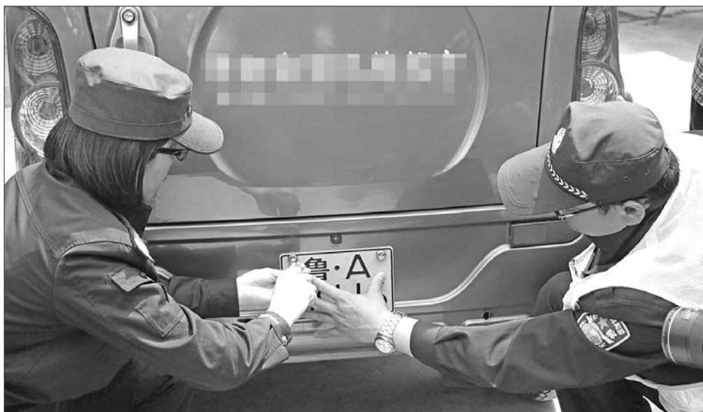
车管所工作人员正在给电动三轮车挂牌。

此次,老年代步车以“正三轮摩托车”身份取得机动车号牌,在全省范围内尚属首例,这也反映出对此类车辆加强管理的信号,相信未来必将有越来越多的电动三轮车品牌车型列入工信部产品目录。