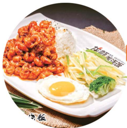
南拳妈妈龙虾盖浇饭