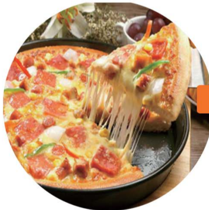
精品披萨 匠心顶料

收各种肉类和配菜的鲜味，加入本身的调料香味，混合起来以后，成就了“一锅香”。麻辣香锅是将天南地北的食材，融入一锅，食客享受的是丰富与多样。