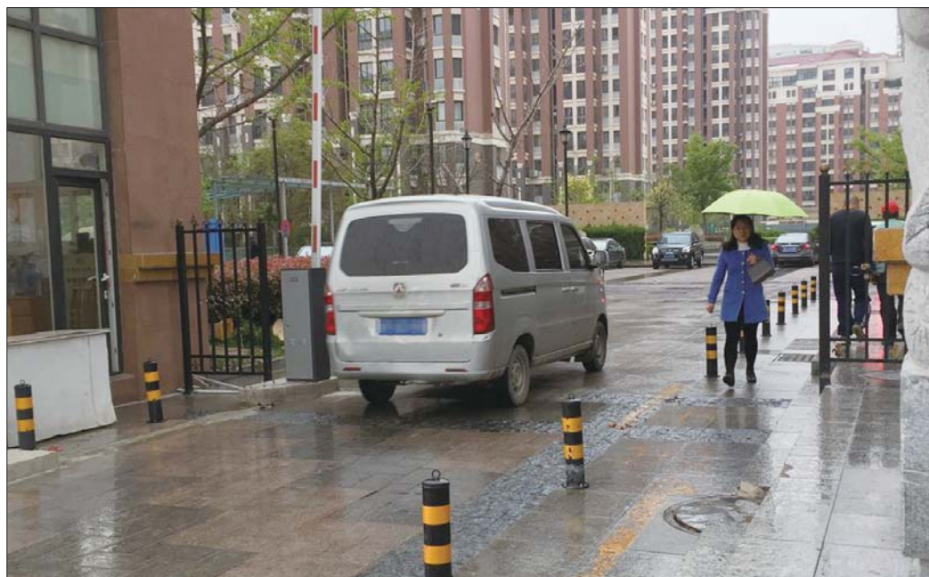
5月1日起,烟台市区小区将执行新的停车收费标准。

本报4月24日讯(记者 梁莹莹) 24日,烟台市物价局召开新闻发布会,会上就物业收费有关问题进行了解读。市物价局、市住建局印发《关于烟台市市区普通住宅物业管理区域内停车收费有关事项的通知》,公布了依据有关法律法规和规定制定的普通住宅物业管理区域内停车收费标准。室内车位停车费(租赁费+车位服务费)最高不得超过258元/车位·月,室外车位停车费(租赁费+车位服务费)最高不得超过145.20元/车位·月。