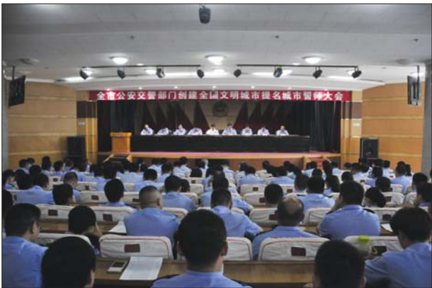
7日,全市公安交警部门“创城”誓师大会召开。

交警部门将加快简易程序交通事故处理权限下放,完善轻微交通事故快速理赔机制,避免造成行车延误和交通拥堵。要规范停车管理,研究制定停车场管理