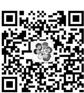
扫码填写报名信息。

是一部励志喜剧电影,马哈维亚·辛格·珀尕是印度国家摔跤冠军,却因生活所迫放弃摔跤。他希望儿子可以帮他完成梦想——为印度赢得世界级金牌。不料命运让他生了四个女儿,偶然的机会他开教养女儿摔跤,努力使女儿变成世界级的摔跤手,期间趣事多多…… 活动时间:14日上午9:30集合,10点正式观影。 活动地点:鲁信影城(青年路银泰中心4楼) 活动报名:关注今日泰山小记者团,发送(孩子姓名+母亲姓名+联系方式)到后台留言区。限额70名,额满为止。