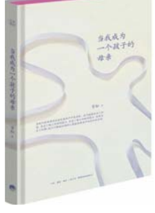
《当我成为一个孩子的母亲》雪松 著 生活·读书·新知三联书店