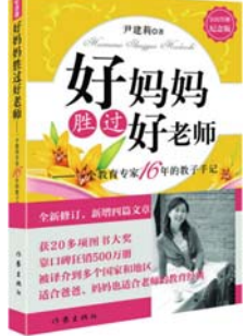
《好妈妈胜过好老师》尹建莉 著 作家出版社