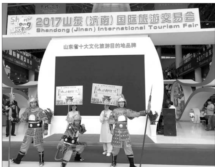
21日,2017山东(济南)国际旅游交易会落下帷幕。