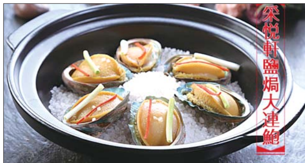
采悦轩盐焗大连鲍

采用广东一带自然和气候天气种植鲜沙姜，具有化痰行气，消食开胃，健脾等功效，用鲜沙姜去皮洗干净加清水煮开之后，加入大连鲜鲍浸泡30分钟，捞起，口感肉质鲜爽、Q弹。此菜品得到广大美食家好评，同时荣获粤菜广、港烹饪大奖。