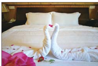
泰山温泉城内的温泉别墅。

落里的乡奢艺术酒店,它由23位来自世界各地的顶级建筑师独立设计。民宿旅游眼下已成为一种休闲旅游的时尚,汶口古镇还原和营造了一种精致的乡村生活状态,旅游者来到这里,能体