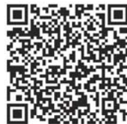
扫描二维码看访谈视频。

学校成立之初就明确提出——让每一个孩子都享受最平等的优质教育。将“小班化”定位为学校班级组建框架,每班学生严格控制在56人以内。在“小班化”、“分层辅导”的教育模式下,采用“小组合作”学习形式和“小组捆绑式”评价机制是学校教学又一优势和特色。