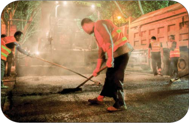
高温沥青上辅助作业。