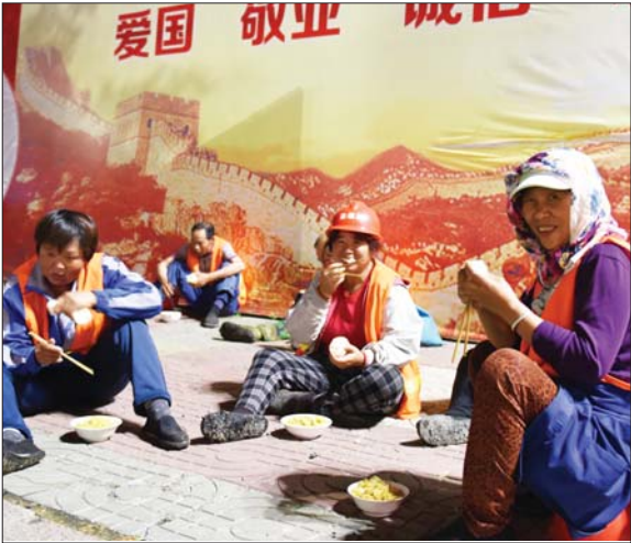
交替着吃饭不停工。