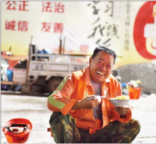
吃顿夜宵补充能量。