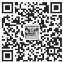
济宁卫生计生官方微信

关注“济宁卫生计生”微信公众号，将献血故事、图片发送后台，也可以发送至邮箱qlwb001@163.com。