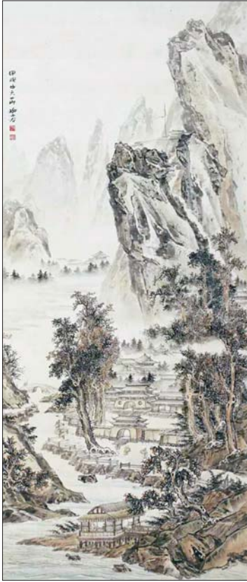
▲柳子谷 溪山清秋 133x56cm