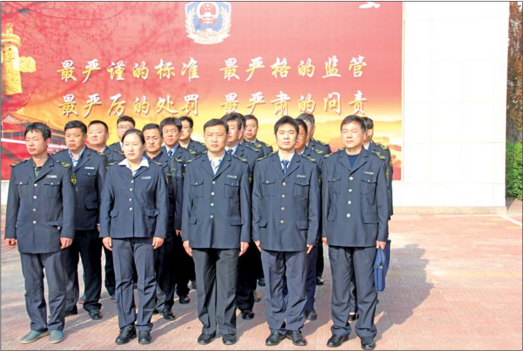
商河县食品药品监督管理局工作人员。

记者： 眼下，食品(药品)安全越来越受到市民的关注，能造成系统性、区域性风险的问题，或群众反映强烈、社会关注度高的问题越来越多，在食品(药品)安全方面，咱们部门又