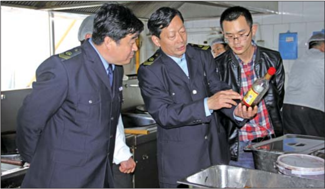
工作人员走进食堂进行食品专项检查。