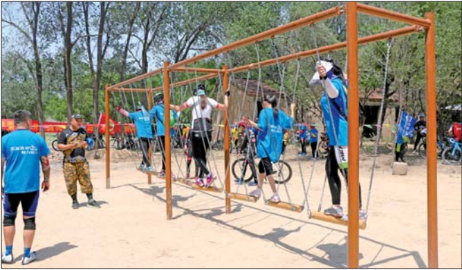
骑游爱好者在店子张体验户外活动。

此次活动吸引了来自河北、济南、德州、滨州等地的8支自行车队、超过500名骑友参与。骑游队伍中,一支由山东大学留学生组成的“洋车队”尤为引人注目,成为本次活动中的焦点。参加活动的骑友们从交