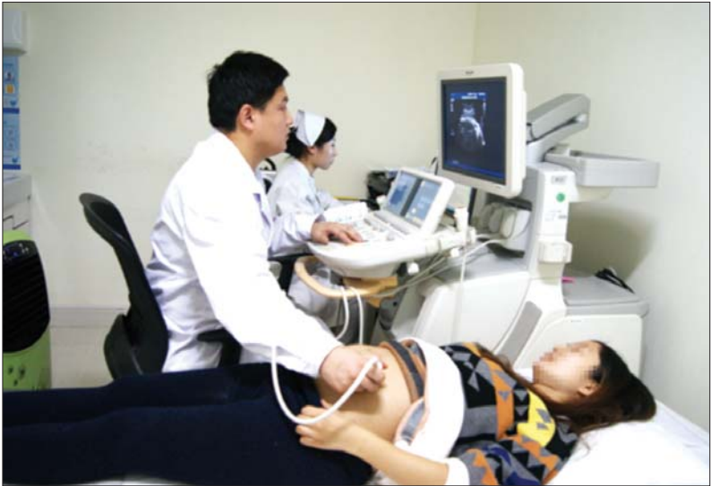
东昌府区妇幼保健院超声科

目前我国中孕期超声结构筛查已成为产前诊断的重要组成部分,但中筛时发现胎儿异常然后终止妊娠,会给孕妇及其家庭产生较大的生理和心理创伤,还会造成社会资源的不必要浪费,曾经有一个孕妇,在东昌妇幼做早筛,检查出胎儿多项指标显示有风险,但孕妇认为孩子还没长好,就没有在意,等到中筛的时候,确定孩