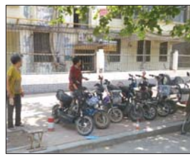
收费大妈“圈地”收费。

此外,记者从牡丹警方获悉,7日上午8点05分,北城派出所接110指令:在长城中学考点附近有人因停车收费发生争执。北城派出所民警迅速赶到现场,原来是家住附近的两个老人称公路两边的地是他们村的,向考生家长收取停车费而与考生家长发生争执。随后,派出所民警赶到,一边安抚考生家长,一边对老人批评教育并劝离。