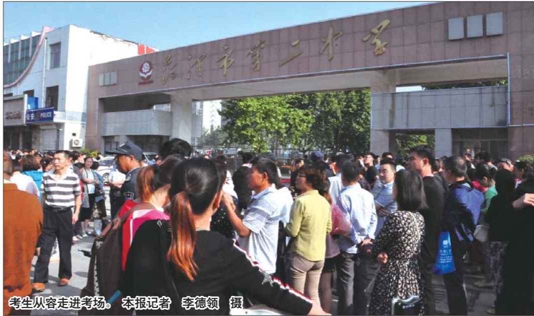
考生从容走进考场。

本报再次提醒,孩子高考压力大,难免粗心,家长一定要帮孩子检查一遍准考证、身份证携带情况,遗漏会影响考生情绪。