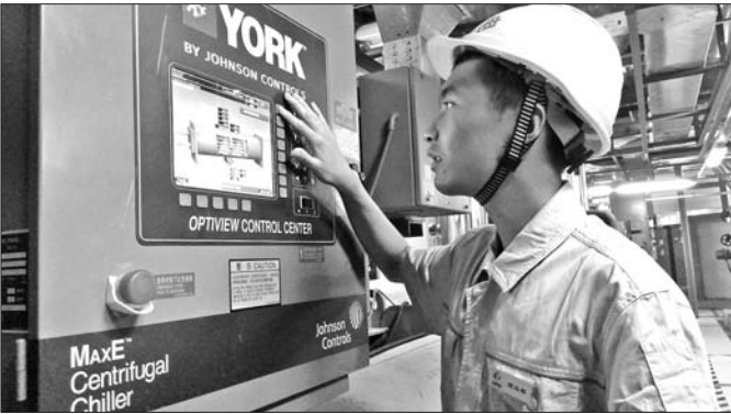
济南热电给绿地中心提供制冷服务,图为工作人员在操作设施。