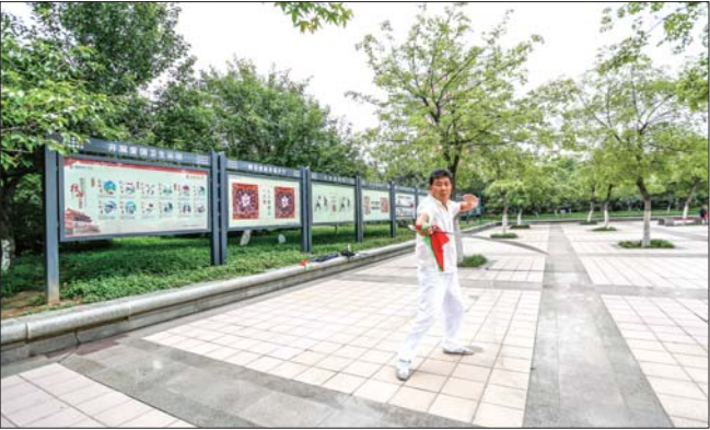
设置公益广告,营造创城氛围。

本报济宁6月13日讯(记者 孟杰 通讯员 张刚) 目前,济宁高新区创城办把户外公益广告建设作为创建全国文明城市工作的重点之一,营造出一个“抬眼可见、举足即观”的浓厚创建氛围。 济宁高新区创城办多次召开专题调度会议,坚持逐街逐巷排查,每天每周调度,不断夯实责任,切实强化督导,狠抓任务落实,在主次干道、广场绿地、商业大街、公共设施等公共区域,充分利用大型宣传展板、城市小品景观、宣传栏、电子显示屏等多种形式,大力度、高强度、广密度扎实开展创城社会宣传工作。 今年以来,济宁高新区