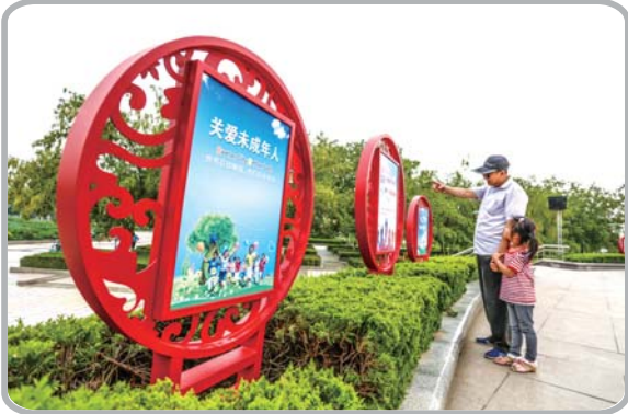
提升文明素养,从孩子教育做起。

明、和谐旅游环境。还建立了广场文化区,掀起唱红歌、唱和谐、传幸福的热潮,让更多的市民加入到文化活动中来。