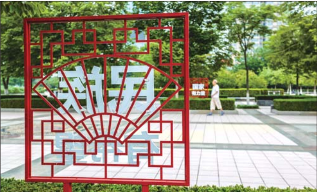
融入传统文化,打造文明阵地。 地,成为了高新区慈善文化活动的热点地带。 同时,高新区启动“文明出行旅游公约”,从市民的切身利益出发,大力营造广场文

林木郁郁,草色青青,三五成群居民遛弯、锻炼,其乐融融。走进济宁高新区——社会主义核心价值观主题广场,展板、木刻、书法、橱窗,富中国传统文化元素各类造型呈现眼前。这里的小景诠释了社会主义核心价值观内涵,让游客在休闲娱乐中陶冶情操,形成了主题鲜明、特色凸显的精神文明建设新阵地。 近年来,济宁高新区不断倡导“兴公益,泽社会”的社会风尚,提高了人民群众对慈善事业价值的认识。区内的医院、社会公益组织及爱心人士在主题公园多次举办了义诊、义演、义务咨询等慈善公益活动。主题广场俨然成为了慈善事业的宣传阵