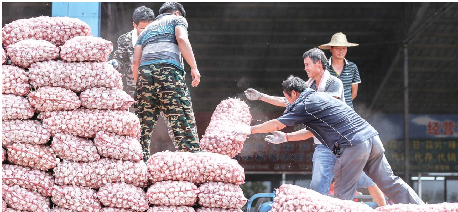
20日,在金乡一大蒜交易市场上,工人们正在装卸大蒜。

大蒜,几乎每个家庭的餐桌上都有。因其不可或缺,价格起伏格外引人关注。去年大蒜价格走高,今年收购价腰斩,仅为去年一半。涨跌之间,背后是哪只“手”在操控?本报记者走进田间地头,走访蒜农蒜贩蒜商,探究扑朔迷离的蒜价之谜。