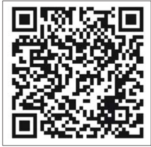
聊城仲裁文明聊城 拍客团

报、齐鲁壹点、聊城仲裁网、聊城国土资源局官网、聊城仲裁微信公众平台集中展示。获奖摄影作品集册展览,并举办颁奖典礼。