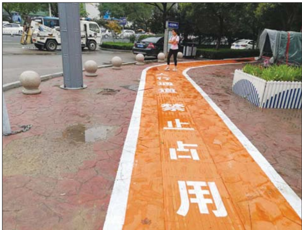
图为在百大路口,交警部门施划的彩色标线。

据了解,为创造文明的交通环境,聊城交警部门将进一步严厉查处占用盲道、非机动车道和人行道通行