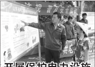
开展保护电力设施宣传活动

6月16日,齐河县供电公司在全县开展了电力设施保护和安全生产用电宣传活动。通过发放宣传资料和提供现场咨询的方式,指导居民如何依法用电、安全用电、科学用电,向广大市民宣传和普及电力设施和电力法律法规知识。