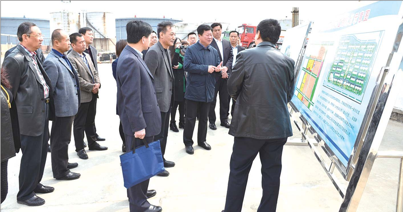
图为垦利油工委主要领导向来学习取经的滨州市滨城区油区办来宾介绍油地建设情况。

垦利是胜利油田的主产区,垦利油区工委领导一班人审时度势,紧紧围绕工农工作实际,完善“超前、跟踪、善后、规范”服务模式,确保油田施工及地方重点工程顺利实施。今年以来,累计清理违碍树木1100余棵,为油田东区供电公司更换光缆5公里、修建铁塔2处、更换线杆3根,全长25km的东辛采油厂盐家区片高压线路改造工程正在施工,完工后可为油田排除多处电力安全隐患,确保油田生产安全。对涉及垦利区的油田单位施工作业全面登记、备案,严格规范办理油田施工作业核准证40余份,保障油田物探公司罗家工区勘探施工顺利开展。协调油田积极配合,搞好管线迁占,确保孤罗德、孤永东重大输油管线工程顺利完工,消除安全隐患60余处,孤东辛输气管线改造工程已接近尾声。积极服务地方