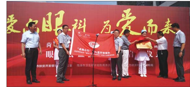
与会领导向“点亮心灯”眼科医疗扶贫队代表授旗、授牌。 本报记者 董梦婕 摄

“眼科下乡 精准扶贫”眼病公益救助项目活动旨在以“村村到、户户晓”的形式，对全市万余名贫困眼病患者及广大社区、村居民长期进行眼病防盲宣教、建档、解决好贫困眼病患者转外就医、异地报销不便等难题，建立科学有效的眼病检测和早期干预体系，制定长效的防盲致盲机制，避免全市贫困患者群体因贫致盲，因盲返贫。菏泽市辖区内建档立卡、参加社保统筹的贫困居民及优先安排纳入全市民政低保，五保救助的患者，被纳入此次活动的救助范围，菏泽爱尔眼科医院作为项目实施单位，将精心组织