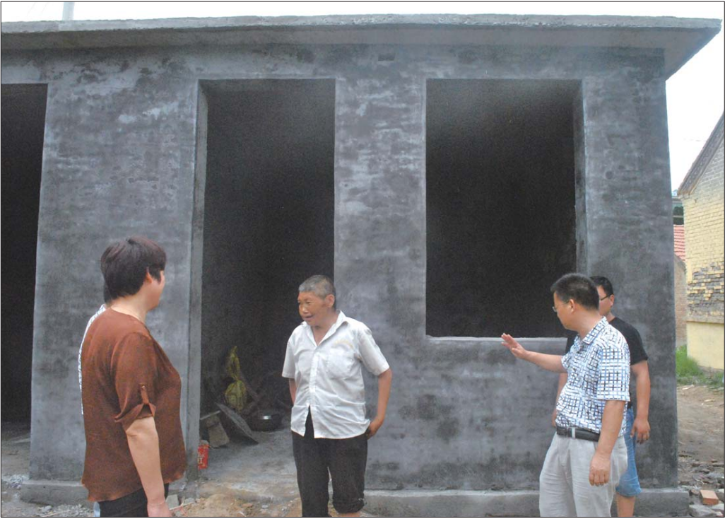
高新区扶贫人员在新建安居房前与贫困户交流。

要求，确保不落一户。全区需改造321户，c级128户，d级193户。在摸底调查的基础上，积极筹措资金，所需危房改造资金由区、镇街、村、户分级负担。 该区立足实际情况加大贫困户危房改造力度，原则上翻建一户补10000元，修缮一户补3000元，区财政拿出240万元用于危房改造，其余资金由镇街、村负担；村可组织党员和干部帮工和义务工参与建设；户可集中现有物料用于建设。严格标准、统一施工。必须达到主要部件合格、结构安全。改造后的农房应具备卫生厕所、人畜分离等基本居住卫生条件。 据了解，为保障农村建档立卡贫困户住房安全，大力实施安居扶贫工程，确保脱贫攻坚期内全面完成建档立卡贫困户危房改造任务，稳定实现“两不愁、三保障”目标，高新区立足实际情况加大贫困户危房改造力度，目前，该区已完成危房改造80户。