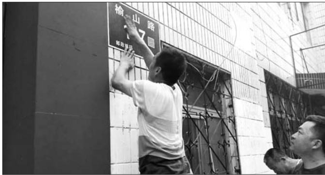
平阴县全面换装二维码智能门牌。

6月19日,西城医院项目定址济南市国际医学科学中心。济南市规划局对济南西城医院及医学研究院建设项目建设用地规划进行批前公示,规划显示,济南西城医院项目具体地点位于京沪高铁以西、京福高速以东,规划建设用地面积7.44公顷。目前,济南市国际医学科学中心的战略和产业等规划还正在编制中,预计年底完成。