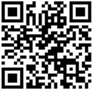
扫码观看现场视频。

一位家长慌乱中,买的东西散落一地。等把孩子抱起走上扶梯到了一楼,才把地上的物品拾起来。 家长站在电梯上,好久没缓过神。小车搬走后,电梯才再次启动。