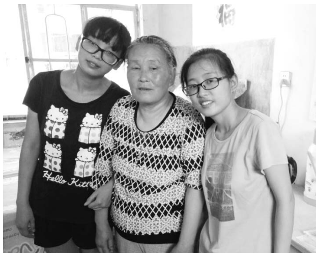
姐妹两个和妈妈在一起。