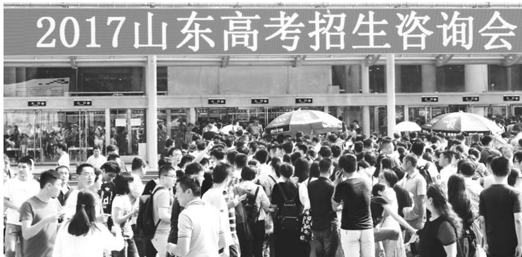
2017年山东高校招生咨询会。

根据山东省高考录取批次,本科批次的志愿填报和录取渐入尾声,7月24日开始,专科(高职)提前批开始填报志愿。高考成绩不理想上不了本科?没关系,7月22日来专科咨询会转转,去高职院校学个特色专业,人生同样精彩。与本科不同,专科院校填报志愿不稳定因素更多,不同院校间录取分数差异较大,如何选择好专业也是一门学问。一旦选不好,打水漂的不仅是高昂的学费,还有四年光阴。