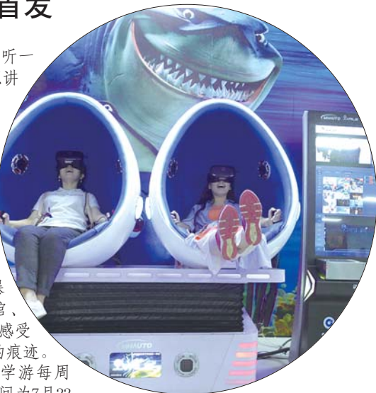
游客在诸城迈赫机器人生产基地体验馆内玩得很嗨