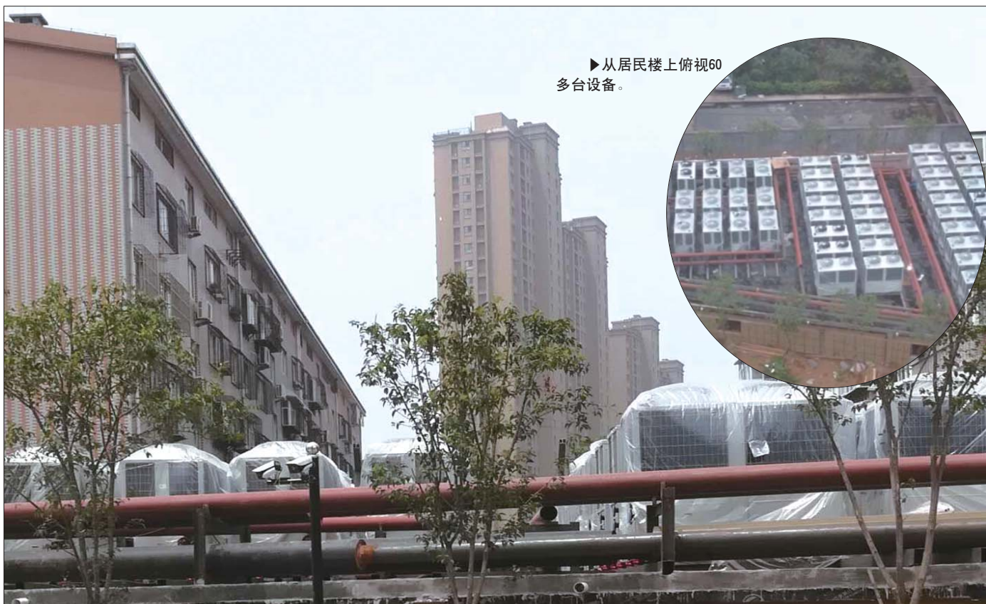
▶从居民楼上俯视60 多台设备。

“除了房顶有管道，房子内部也都是管道，管道主要连接小区一期和二期，把管道和低温空气源热泵安装好之后，我们在外面还会加盖一层隔离板，不会让它们直接暴露在外面的。”附近正在施工的人员表示，这些设备